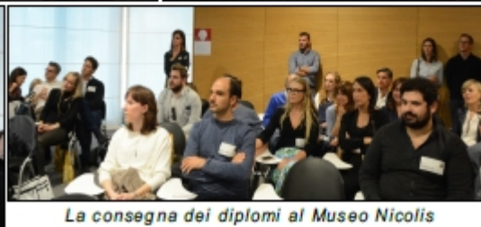
La consegna dei diplomi al Museo Nicolis