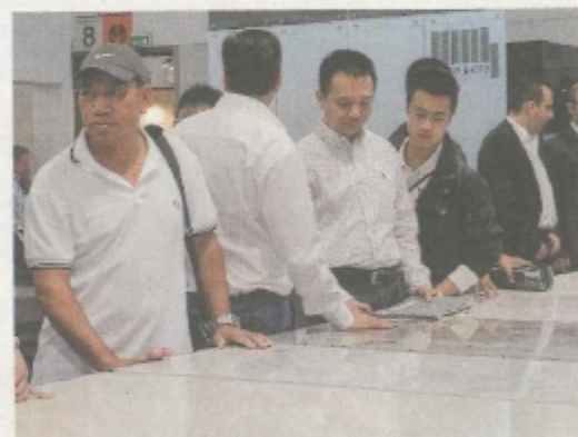
Operatori e buyer stranieri al Marmomac 2016

Il trend è confermato (+2,5%) anche nel primo trimestre di quest'anno, che ha chiuso a 96,1 milioni contro i 93,8 dell'anno precedente. Da maggio però le vendite oltreconfine hanno rallentato e il bilancio del semestre risulta negativo, con una perdita del -1,5%, a 212,5 milioni di euro contro 215,7 del 2016. In questo periodo, in controtendenza rispetto al dato nazionale, aumentano le esportazioni scaligere di lavorati e semilavorati negli Stati Uniti, per un controvalore totale di 57,7 milioni (+6,9%). Bene anche Francia (10,9 milioni; +13,1%), Paesi Bassi (4,5 milioni; +12,9%), Belgio (3,7 milioni; +5,6%), Kuwait (4 milioni; +33,9%), Messico (3,8 milioni; +24,0%), Spagna (1,2 milioni; +40,8%). Nonostante negli ultimi venti anni siano mutati gli equilibri di mercato, con il baricentro di produzione e lavorazione di pietra e marmo sempre più spostato in Asia, in particolare in Cina, India e Turchia, Paesi a cui è riconducibile il 55% della produzione globale, il ruolo guida per business, cultura, formazione professionale, sperimentazione e avanguardia nel settore lapideo resta saldamente in Italia e più precisamente a Verona. Sul territorio hanno sede 541 imprese, 99 delle quali saranno presenti come espositrici a Marmomac, che rappresentano il primo distretto lapideo in Italia. Complessivamente in Veneto le attività della filiera sono invece 1.227, con Vicenza al secondo posto a quota 294 unità, seguita da Treviso, a 121.