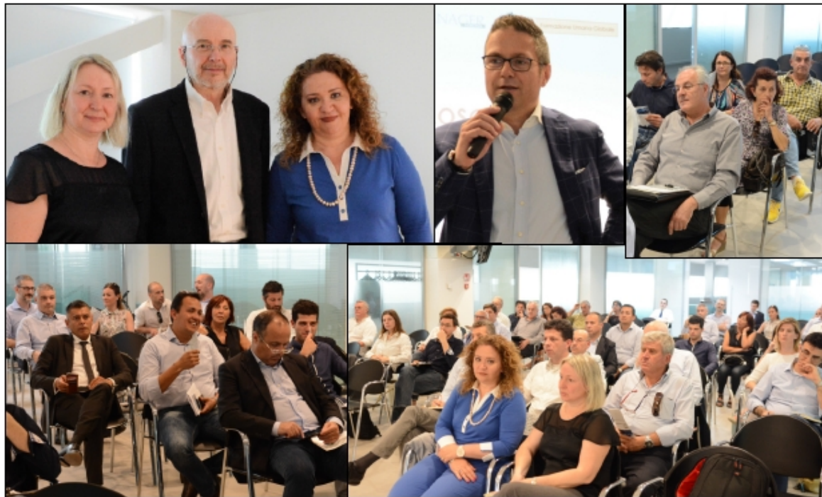
L'incontro di Apindustria alla Vicentini di Via Gardesane FOTOSERVIZIO::

L'incontro ha consolidato la collaborazione tra Apindustria e Federmanager "Non si può replicare il sistema Toyota senza preoccuparsi dei valori e della cultura"