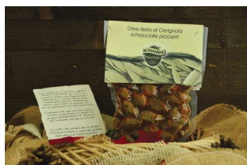
CODICE S018 € 8,00 cad. Olive Bella di Cerignola da gr.500, schiacciate e piccanti, Frantoio Bonamini - Illasi.