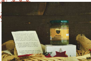
CODICE S009 € 4,50 cad. Pesto alla genovese da gr.180. Frantoio Bonamini - Illasi.