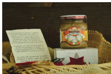
CODICE S011 € 6,00 cad. Salsa tartufata con tartufo nero della Lessinia da gr.90. Condimento a base di funghi con tartufo, Terra Cimbra snc.