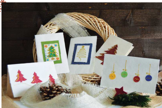
1 Kit da 5 pezzi Biglietti assortiti Regala un'ora di autonomia sociale e personale CODICE ASS.B021 € 15,00

Biglietti con busta 11 cm x 17 cm, realizzati interamente a mano con carta riciclata fabbricata presso il laboratorio Monteverde di Tregnago.