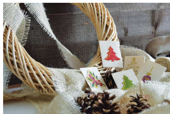
1 Kit da 5 pezzi Chiudipacco Acquista 3 kit e regala un'ora di autonomia sociale e personale CODICE ASS.B022 € 5,00

Biglietti con busta 11 cm x 17 cm, realizzati interamente a mano con carta riciclata fabbricata presso il laboratorio Monteverde di Tregnago.