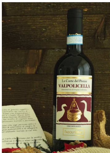
CODICE S010 € 9,00 cad. Vino Valpolicella Doc biologico da 75cl - 14% vol "La Corte del Pozzo". Cantina Fasoli Gino - Colognola ai Colli.