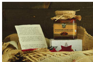
CODICE S017 € 9,00 cad. Pomodoro essiccato da gr.280, in olio d'oliva, Frantoio Bonamini - Illasi.